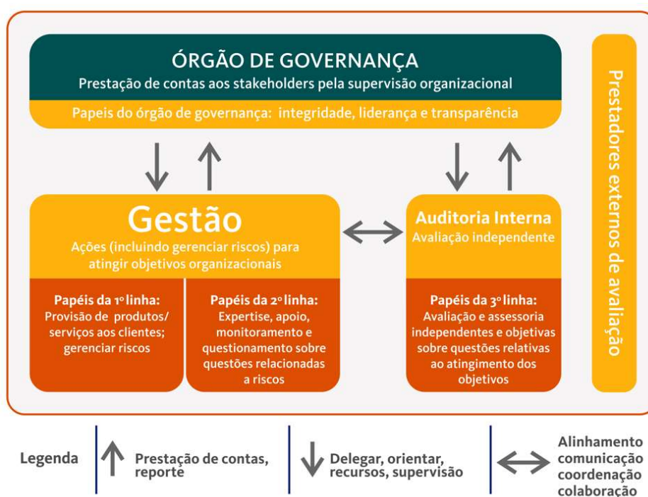
Figura 4 - Modelo das Três Linhas

As funções relativas ao gerenciamento de riscos na Finep, bem como o relacionamento destes com as funções de auditoria e órgãos de governança e/ou externos, estão estruturadas de acordo com o conceito do Modelo das Três Linhas, conforme a Figura 4.