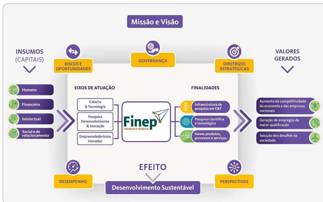
Figura 3 – Modelo de negócios da Finep