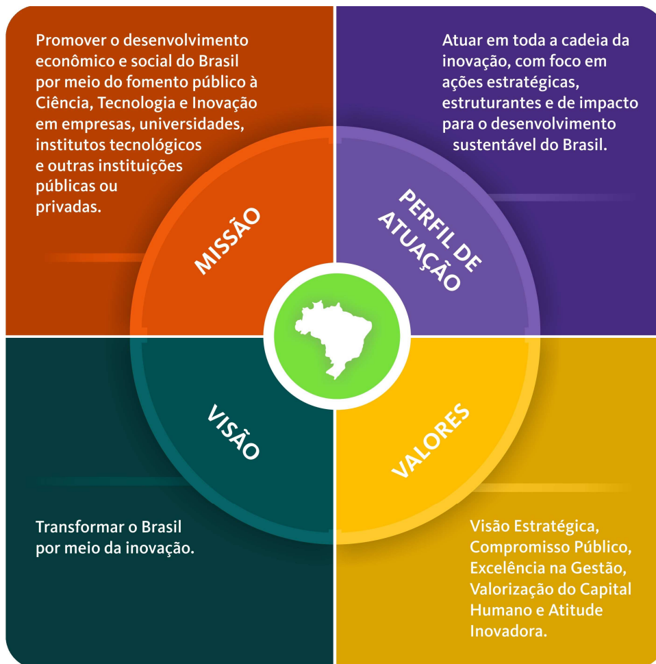
Figura 1 – Referenciais estratégicos da Finep