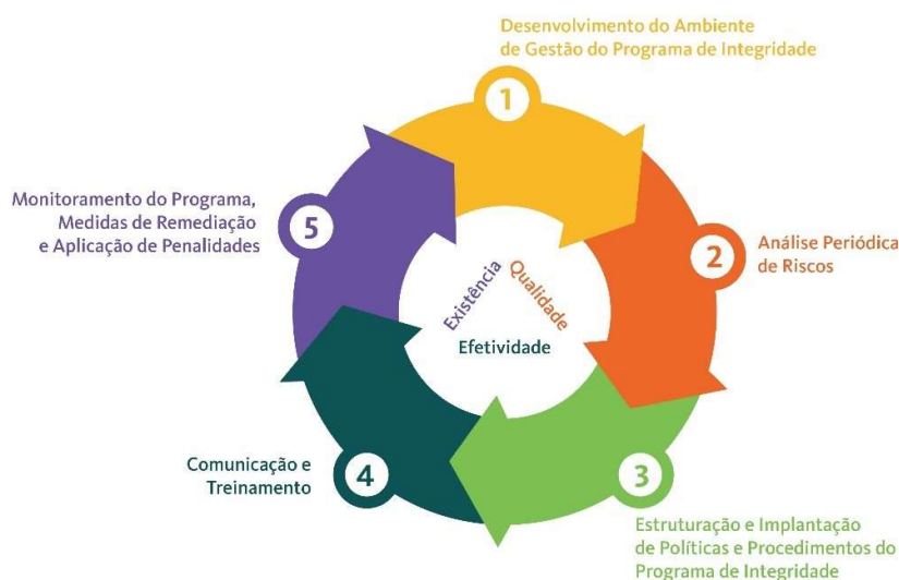
Figura 5 - Dimensões do Programa de Integridade da Finep